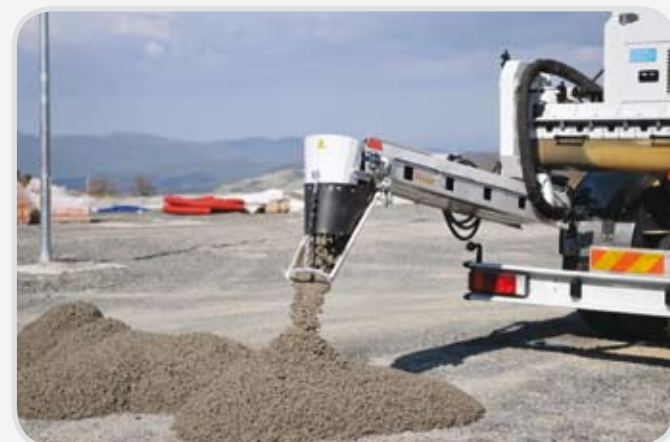
Produzione di qualità