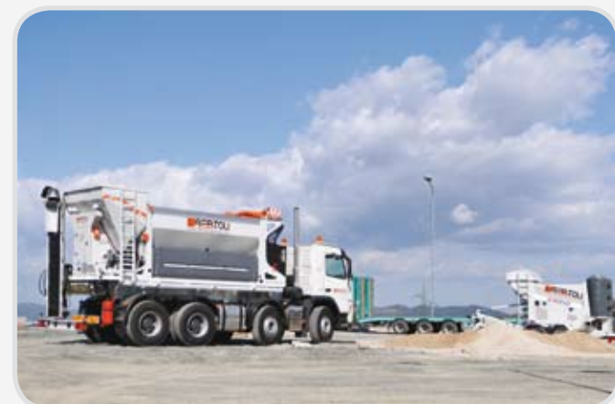
ECOMIX 40S in cantiere

ECOMIX 40S, per le sue caratteristiche costruttive, è un impianto idoneo alla riqualificazione di materiali destinati allo smaltimento in discarica, quali misti cementati rigenerati da calcinacci o fresati rigenerati a freddo con emulsioni.