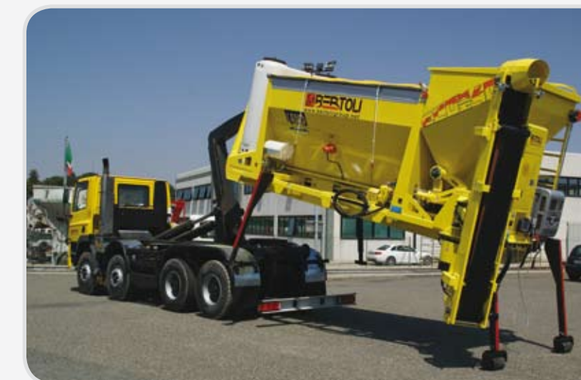
Versione su culla scarrabile