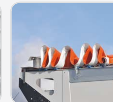
Telo di copertura inerti