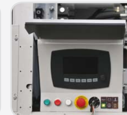
Pannello di controllo computerizzato